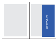
1/2 полосы (ч/б)